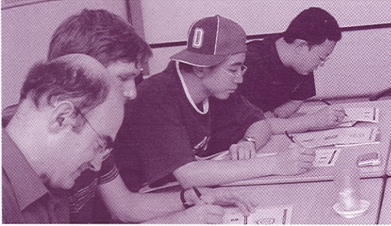
Glasgow School of English students completing the "Happy to Translate" survey