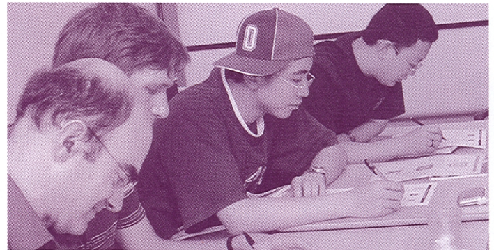
Glasgow School of English students completing the “Happy to Translate” survey