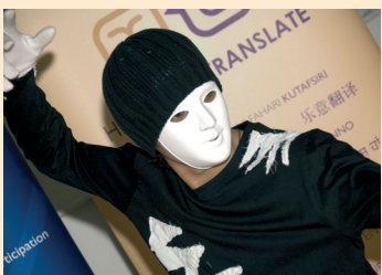
格蘭扁(Grampian) 房屋協會加入

標誌支持團隊，電話號碼：0131 444 4950/1，或者發送郵件至： info@happytotranslate.com